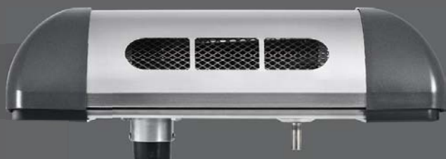
1. Вентагрегат изготовленный из нержавеющей стали