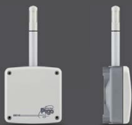
5. Комнатный датчик влажности 4...20 мА /0...10 В