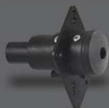
4. Форсунка для парораздачи в турецких банях